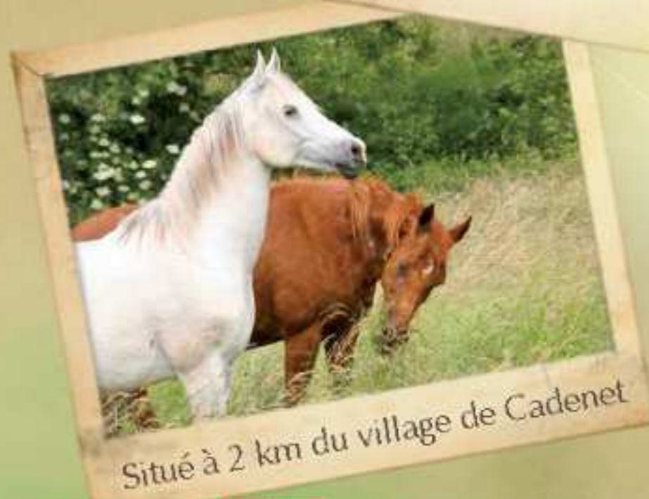
Situé à 2 km du village de Cadenet