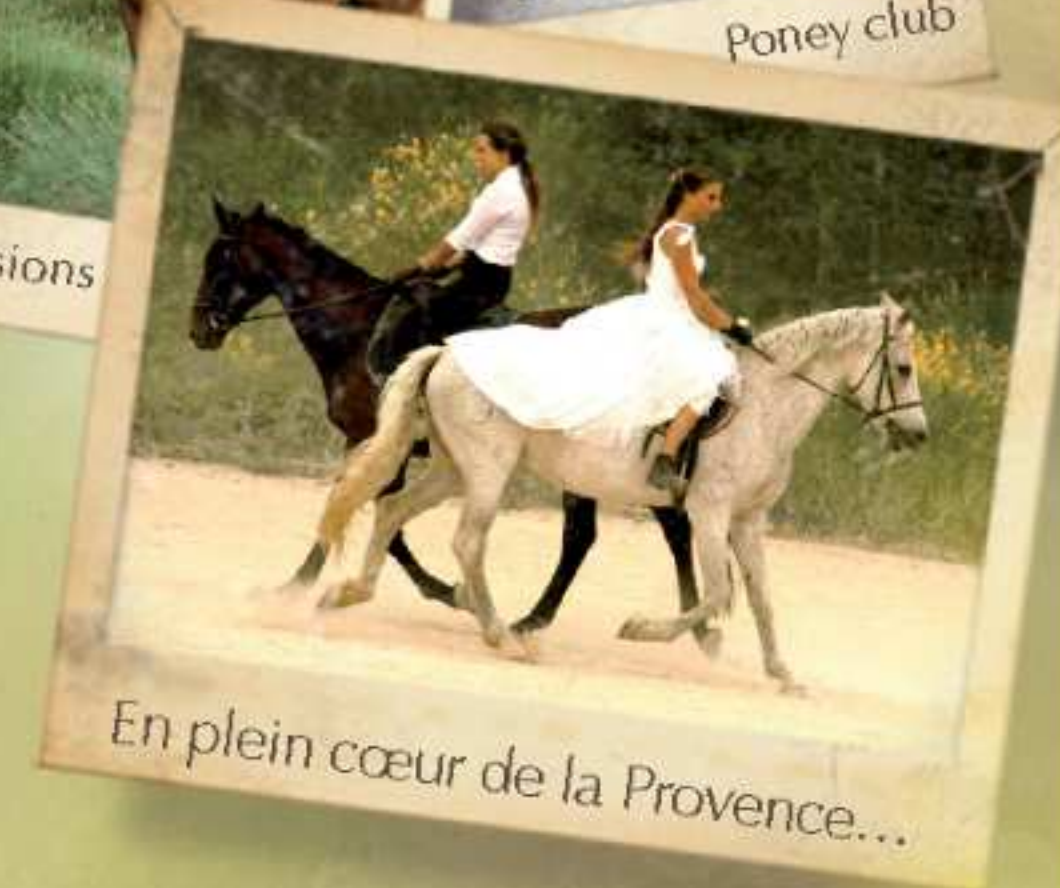
En plein cœur de la Provence...